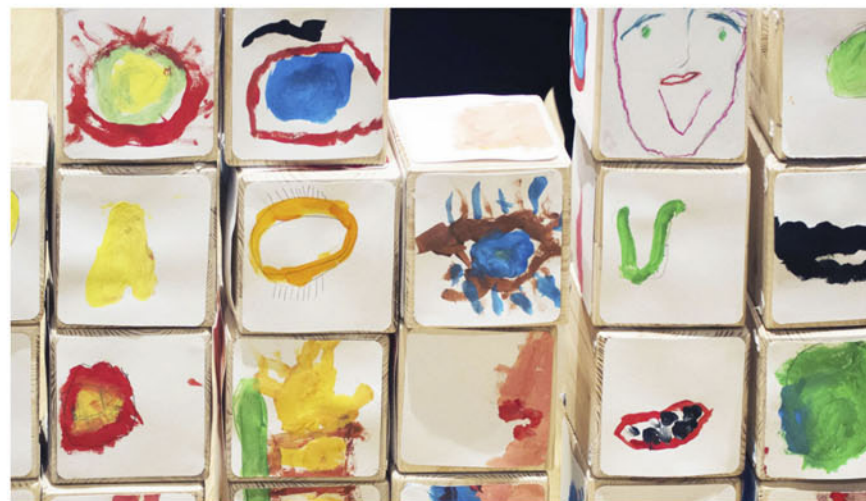
Foto de grupo y detalles de la actividad 'Fragmentos', que tuvo lugar el 14 de noviembre de 2014 en la Fundación RAC con varios miembros de APAMP (Vigo), estableciendo así vínculos con una de las piezas del proyecto Neste momento . Artistas colaboradoras: Alba Fandiño y Elena Cota.