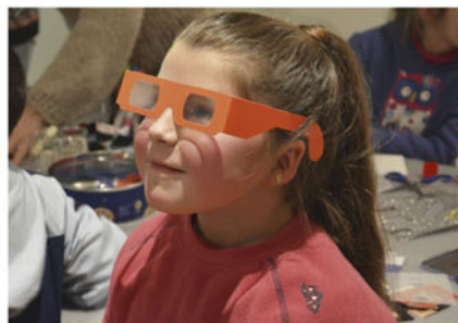
Talleres diseñados específicamente para el proyecto Neste momento .